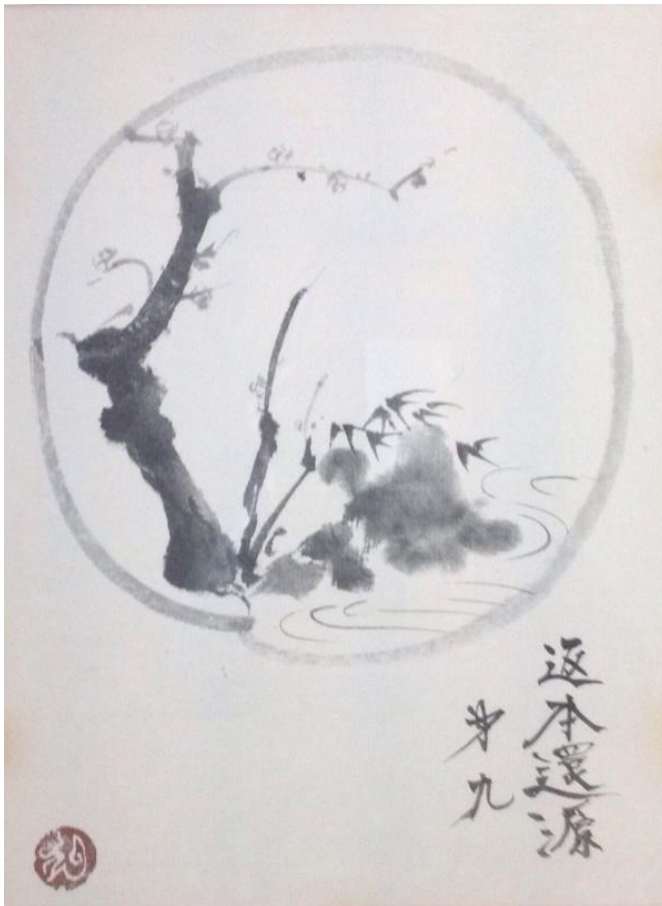
Het negende plaatje: terug naar de bron

Reiziger, je voetsporen zijn de weg, en verder niets. Reiziger, er is geen weg, de weg ontstaat bij het lopen, bij het lopen ontstaat de weg, en bij een blik achterom zie je het pad dat je nooit meer zult betreden. Reiziger, er is geen weg, alleen het kielzog in de zee.