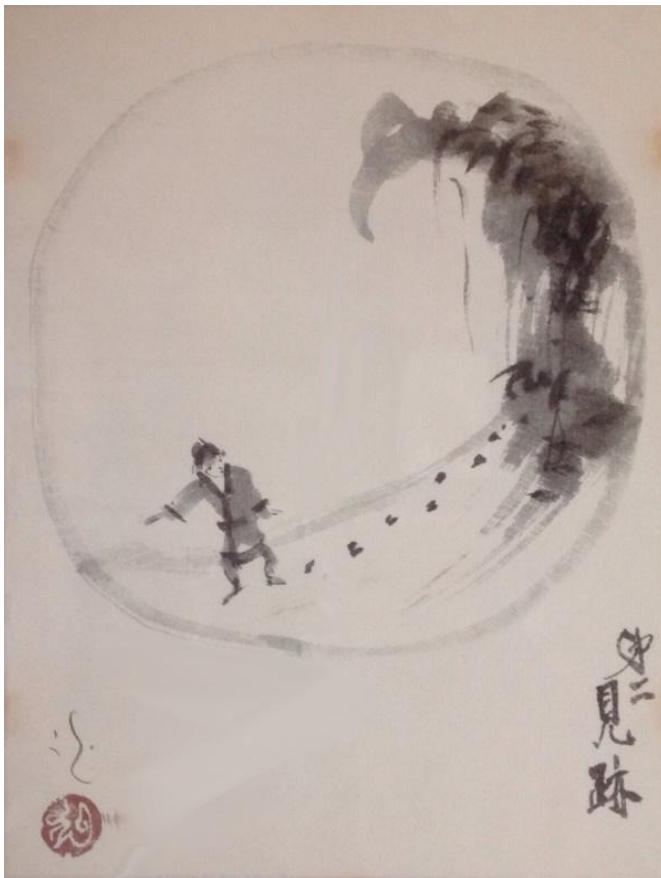
Het tweede plaatje: het zien van de sporen

Anoja had het spoor al ontdekt, maar ze kon nog niet door de poort gaan. Toen de Boeddha haar vroeg: 'Zou je liever op zoek gaan naar de koning of naar de natuur van het zelf?' antwoordde ze zonder te aarzelen: 'De natuur van het zelf.'