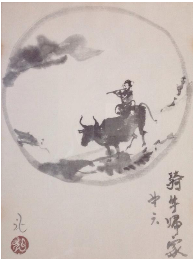
Het zesde plaatje: op de os naar huis rijden